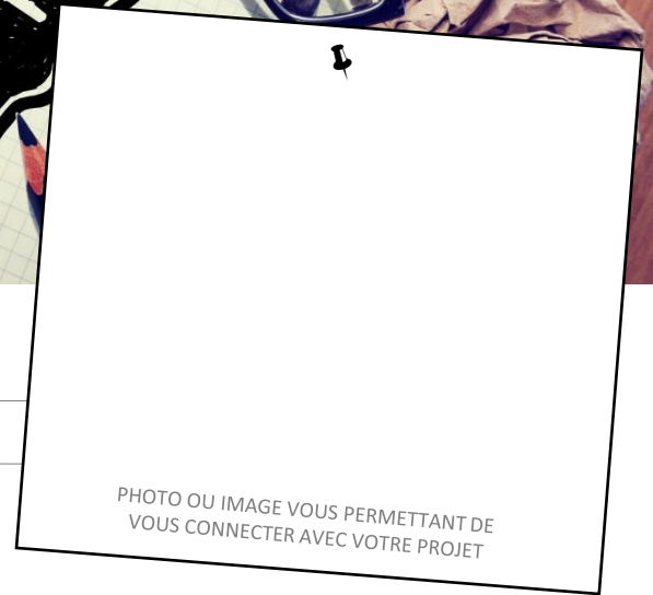
PHOTO OU IMAGE VOUS PERMETTANT DE VOUS CONNECTER AVEC VOTRE PROJET

Vos idées vous donnent du fil à retordre? Nous concevons pour nos clients, entre autres, des outils sur mesure dont le contenu et le contenant s'harmonisent parfaitement pour créer du sens. Nous partageons aussi notre expertise à travers des ateliers pratiques. info@conceptuose.com